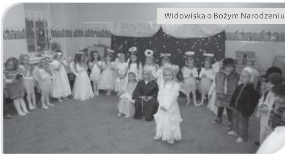
Widowiska o Bożym Narodzeniu