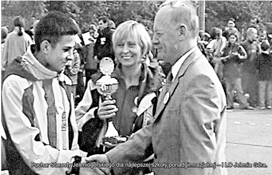
Puchar Starosty Jeleniogórskiego dla najlepszej szkoły ponadgimnazjalnej – II LO Jelenia Góra.

Jubileuszowy XXX Rajd miał być wg moich własnych oświadczeń ostatnim. Że tak się nie stało zdecydowała popularność imprezy, prośby wielu organizatorów i uczestników oraz własny sentyment do imprezy, która przecież wypełniła mi i to w znacznym stopniu 30 lat mojego dorosłego życia.