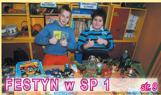
FESTYN W SP 1 str. 9