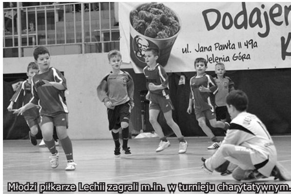
Młodzi piłkarze Lechii zagrali m.in. w turnieju charytatywnym.