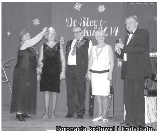
Koronacja królowej i króla balu.