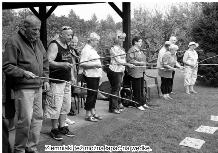
Ziemniaki (też można łapać na wędkę).

• 28 czerwca b.r. nasze koło wraz z Oddziałem Powiatowym Diabetyków zorganizowało obchody Światowego Dnia Diabetyka. W Piechowickim Domu Kultury gościliśmy przedstawicieli diabetyków z całego powiatu. Impreza odbyła się przy finansowym wsparciu piechowickiego Urzędu Miasta za co serdecznie dziękujemy.