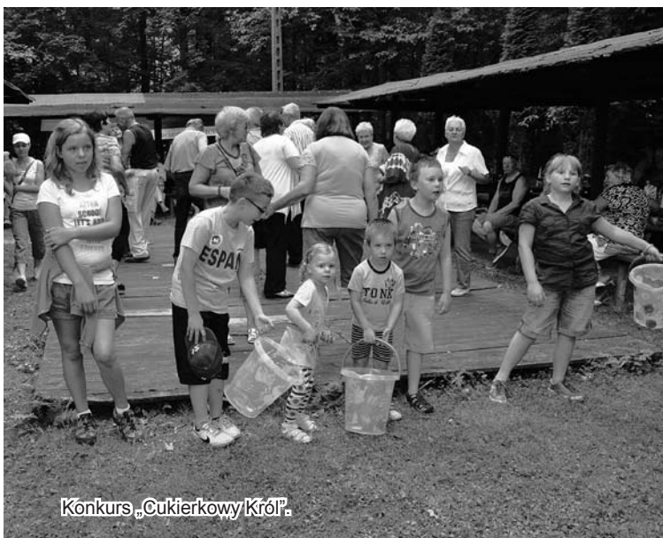
Konkurs „Cukierkowy Król”.