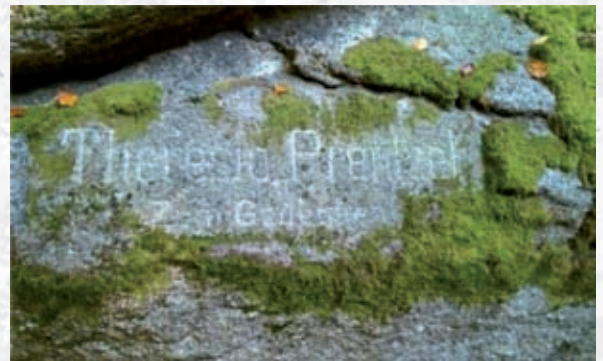
Inskrypcja upamiętniająca śmierć Teresy Prentzel.

Inskrypcja ta została wryta na skale przy starej drodze do Piechowic, ok. 500 m od przystanku w tzw. Piechowicach Górnych. Upamiętnia kobietę, która najprawdopodobniej zginęła rażona piorunem.