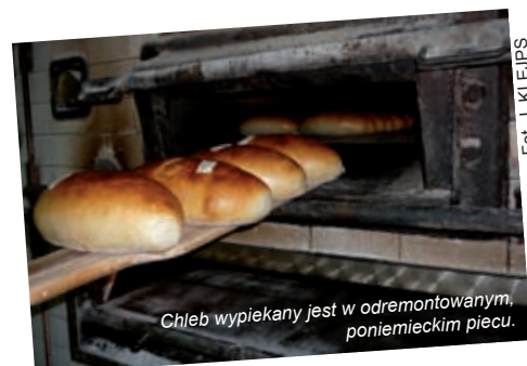
Chleb wypiekany jest w odremontowanym, poniemieckim piecu.

No i co roku musieli negocjować stawki, choć słowo „negocjowanie” jest tu użyte mocno na wyrost. Duża sieć narzucała małowartościemu odbiorcy stawki na granicy opłacalności. A jeśli się nie zgadzali – rozmówca odkładał słuchawkę