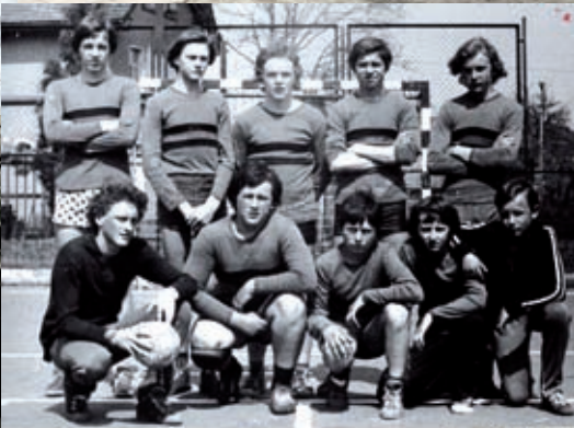
Reprezentacja piłki ręcznej w roku 1976/77 w turmiej A. Majonim.