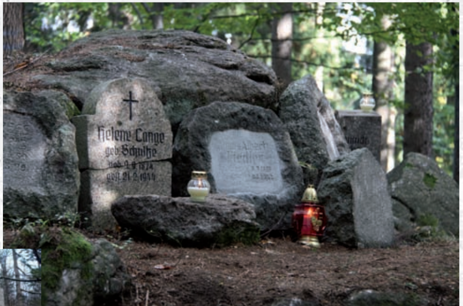
Cmentarz leśny w Michałowicach