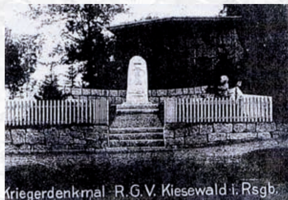
Pomnik ku czci poległych w I wojnie światowej

wie, Turcy czy inne plemiona germańskie, na co ma wskazywać jeden z symboli tzw. „triskelion”, który podobnie jak swastyka występuje ww. kulturach. Inna hipoteza mówi, iż na cmentarzu mogą spoczywać ludzie wierzący w światło lub wyznający kult światła. Dotychczas odkryto 11 nazwisk, choć powinno ich być ok. 58, na co wskazuje metalowa tabliczka odkryta przy jednej z urn. Wśród ustalonych nazwisk znane jest nazwisko karkonoskiego mala-