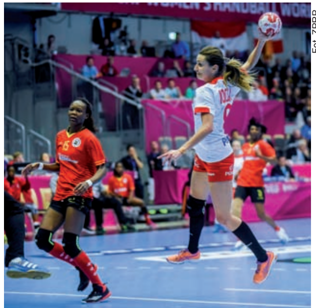
Piechowiczanka w barwach reprezentacji Polski.