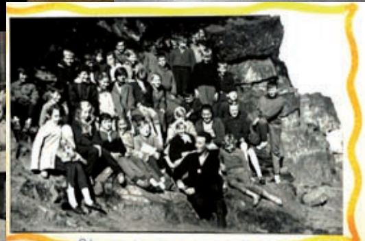
Odpooczywsi na skarpie Smierci (1946)