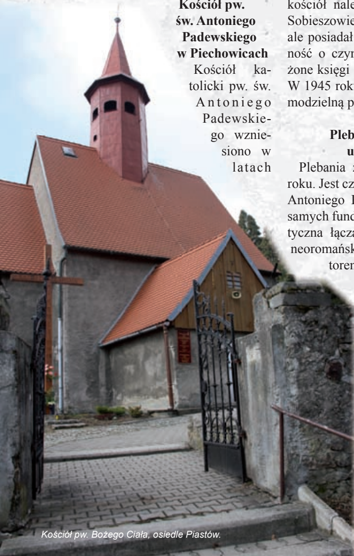
Kościół pw. Bożego Ciała, osiedle Piastów.

Na niemalże płaskiej działce w kompleksie leśnym na grze Piechowickiej, ok. 200 metrów od obecnego Domu Wczasowego „Uroczysko”, usytuowany jest cmentarz