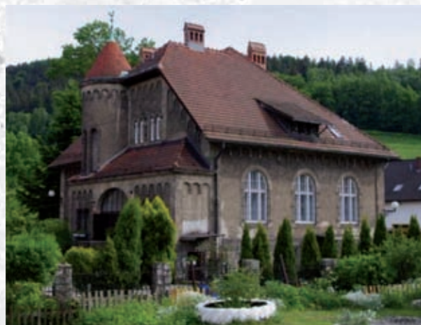
Plebania w Piechowicach.

Kościół wzmiankowany był już w 1399 roku. Obecny, gotycki został wzniesiony na przełomie XV/XVII wieku na murach wcześniejszego założenia pochodzącego z I poł. XIV wieku. Na pocz. XVII wieku dobudowano zakrystię, oraz dodano nowy strop. Sygnaturka i dach pochodzą z 1925 roku. Kościół jest budowlą orientowaną założoną na prostym planie, jednonawowy z kwadratowym, dwuprzęsłowym prezbiterium. Do nawy od strony północnej przylega kwadratowa dobudówka kruchty