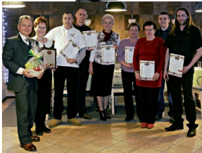
Właściciele i pracownicy piekarni na marcowym spotkaniu z okazji 25-lecia piekarni UliJanka.