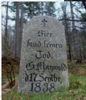
Pamiętkowy kamień Maiwalda

leśny, zwany również sanatoryjnym. Najprawdopodobniej pochówek na tym cmentarzu nie odbywał się w trumnach lecz w urnach. Metalowe urny o wysokości ok. 30 cm zaopatrzone w specjalne pieczęcie zakopywano całkowicie w ziemię w taki sposób, że gromadzono je we wnętrzach trzech stykających się kół o średnicy 6-7 m każde. Na zewnątrz każdego z kół przebiegała regularna ścieżka. Z jednej strony obszar zamknięty był posadzonymi modrzewiami, z drugiej strony rozciągał się widok na panoramę Karkonoszy. Istniały dotychczas przesłanki, że na cmentarzu chowano zmarłych z pobliskiego sanatorium przeciwgruźliczego „Wilhelmshöhe” (po wojnie znany pod nazwą „Uroczysko”), w którym w czasie wojny przebywali ranni lotnicy Luftwaffe. Jednakże żaden z nich nie został pochowany na cmentarzu. Na uwagę zasługuje fakt, iż przy zakopanych urnach stawiano kamienne głazy z wyrytymi znakami. Interpretacja tych znaków jest różna. Przypuszcza się, że są to średniowieczne znaki walońskich górników ewentualnie znaki kamieniarskie wykonawców nagrobków lub starożytne znaki należące do takich kultur jak Celto-