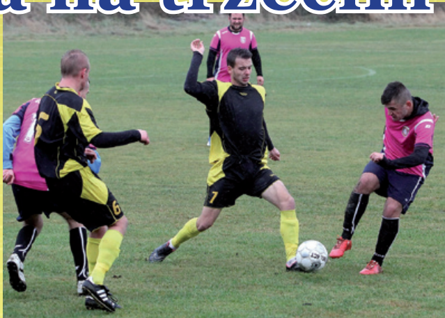
Zdjęcie z meczu Lechia - Pogoń Wleń (3:1).