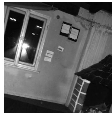
Harcówka przed remontem.

i starszym harcerzom, którzy przez kilka tygodni pracowali przy remoncie harcówki całkowicie społecznie. Mamy nadzieję, iż wysiłek włożony w stworzenie przyjemnej i ładnej siedziby ZHP zachęci młode osoby do