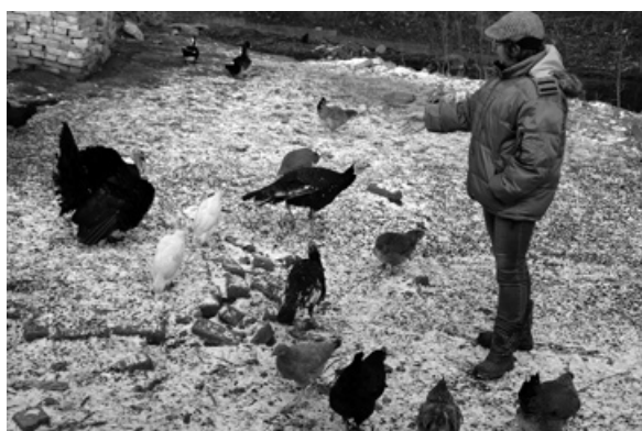
W zagrodzie mają też kury, gęsi, indyki.