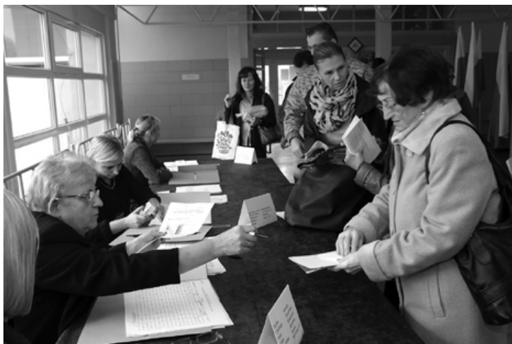
W lokalu Gimnazjum w Piechowicach frekwencja wyniosła 49,91 procent i była najwyższa w mieście.

dą się także przedstawiciele Nowoczesnej Ryszarda Petru (ugrupowanie to uzyskało poparcie 7,60 procent) oraz Polskie Stronnictwo Ludowe (5,13 procent). Frekwencja w wyborach wyniosła 50,92 procent.