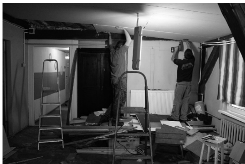
W trakcie remontu.