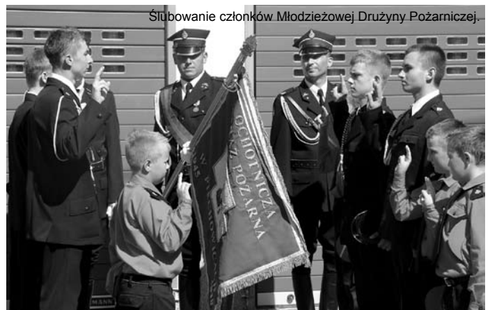
Ślubowanie członków Młodzieżowej Drużyny Pożarniczej.