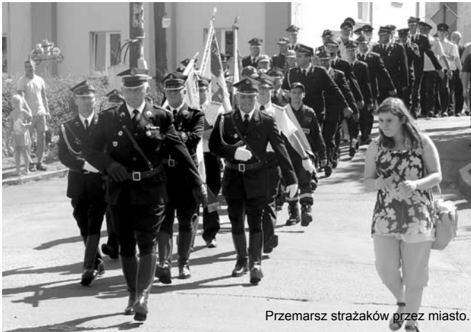
Przemarsz strażaków przez miasto.

30 sierpnia odbyły się uroczystości związane z 70. rocznicą istnienia Ochotniczej Straży Pożarnej w Piechowicach. Najpierw odbyła się Msza Święta w kościele pw. św. Antoniego Padewskiego. Następnie kolumna strażaków przy akompaniamentie orkiestry udała się na ulicę im. Józefa Fliegera, gdzie odsłonięta została pamiątkowa tablica poświęcona pierwszemu wójtowi Piechowic oraz pierwszemu prezesowi OSP Piechowice. Uwiecznieniem uroczystości było ślubowanie Młodzieżowej Drużyny Pożarniczej, a także odsłonięcie tablicy upamiętniającej zmarłych strażaków, którzy przez ostatnie 70 lat czuwali nad bezpieczeństwem mieszkańców. W uroczystości brali udział także strażacy z zaprzyjaźnionego saksońskiego Demitz-Thumitz.