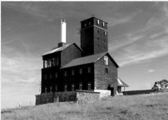
Obecnie z budynku dawnego schroniska nadawane są programy radiowe i telewizyjne.