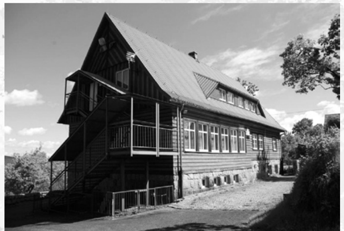
Schronisko „Złoty Widok”.

Obecny budynek został założony na planie litery „L”. Bryła budynku jest rozczłonkowana. Główny korpus głównego budynku w najwyższym punkcie jest trzykondygnacyjny, podpiwniczony, kryty dachem dwuspadowym. Połać południowa i wschodnia jest dwukrotnie większa. Przylegające do korpusu skrzydło jest dwukondygnacyjne również podpiwniczone i okryte dachem dwuspadowym. W centralnej części znajduje się podpiwniczona, dziewięciokondygnacyjna wieża okryta dachem czterospadowym. Budynek osadzony jest na cokole o zróżnicowa-