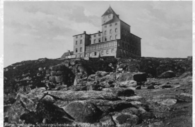
Schronisko Śnieżne Kotły ok. 1938 rok

Od października 1996 roku w obiekcie działała stacja bazowa telefonii komórkowej analogowego systemu Centertel w paśmie 450 MHz. Choć obsługa stacji liczy tylko 3-5 osób, już pierwszej zimy pracownicy stacji uratowali życie jednemu z turystów. Wówczas był to pierwszy taki przypadek. Obecnie, przypadki