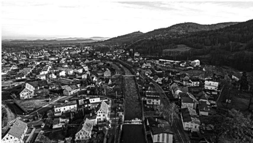
Piechowice z lotu ptaka.

Dorota Piróg Zastępca Burmistrza Miasta Piechowice