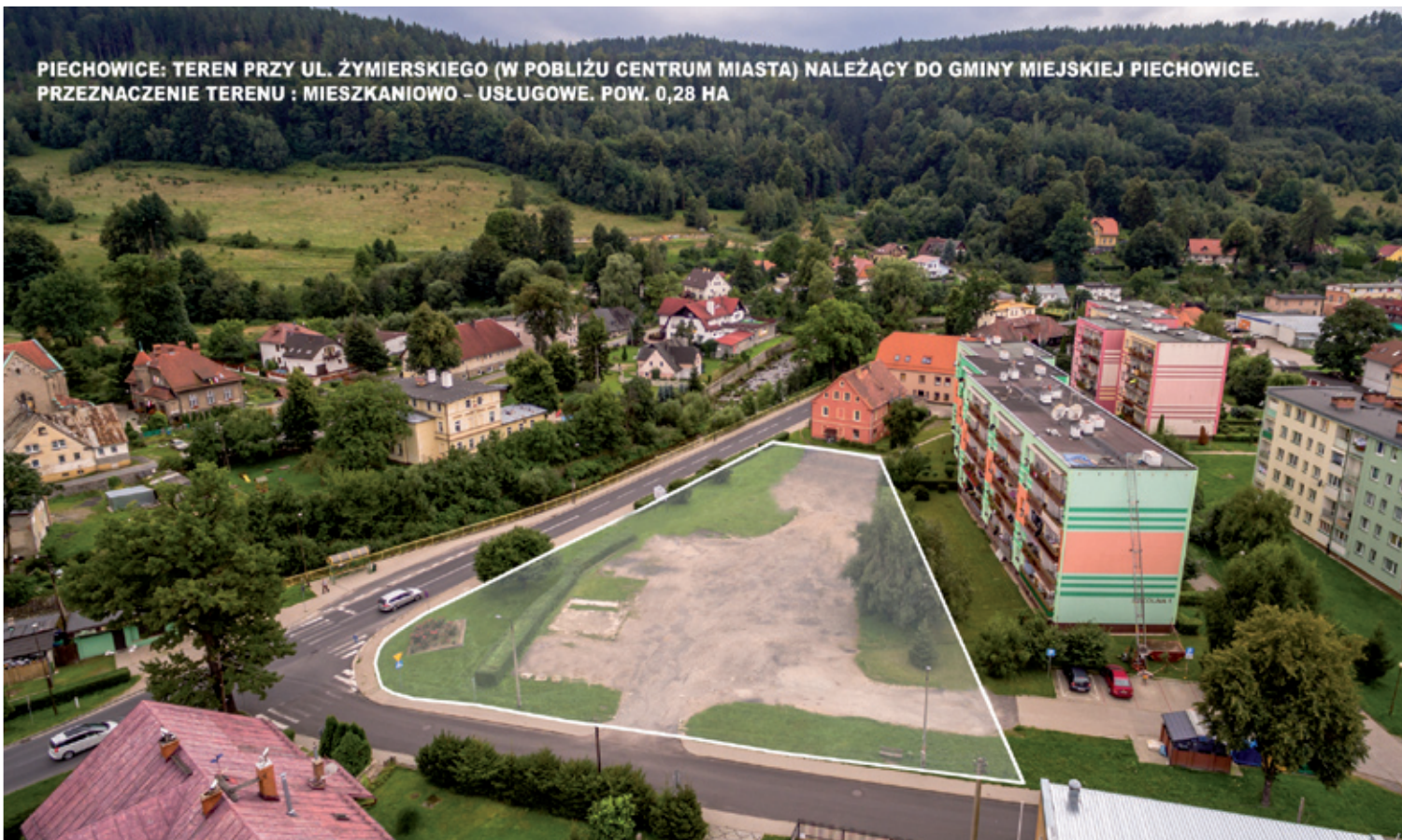
PIECHOWICE: TEREN PRZY UL. ŻYMIERSKIEGO (W POBLIŻU CENTRUM MIASTA) NALEŻĄCY DO GMINY MIEJSKIEJ PIECHOWICE. PRZEZNACZENIE TERENU : MIESZKANIOWO – USŁUGOWE. POW. 0,28 HA

Ośrodku Kultury. Dobrze rozwinięta jest baza sportowa. Mieszkańcy miasta oraz turyści mogą skorzystać z hali sportowej oraz siłowni, kompleksu Orlik oraz infrastruktury stadionu miejskiego. Dla rowerzystów atrakcyjnym elementem jest duża ilość tras o bardzo zróżnicowanym poziomie trudności. Turyści piesi mają do dyspozycji liczne szlaki turystyczne Pogórza Karkonoskiego i Izerskiego, które bardzo często prowadzą do niezwykłych punktów widokowych (Złoty Widok, Kamieniołom Michałowicki, Bobrowe Skały).