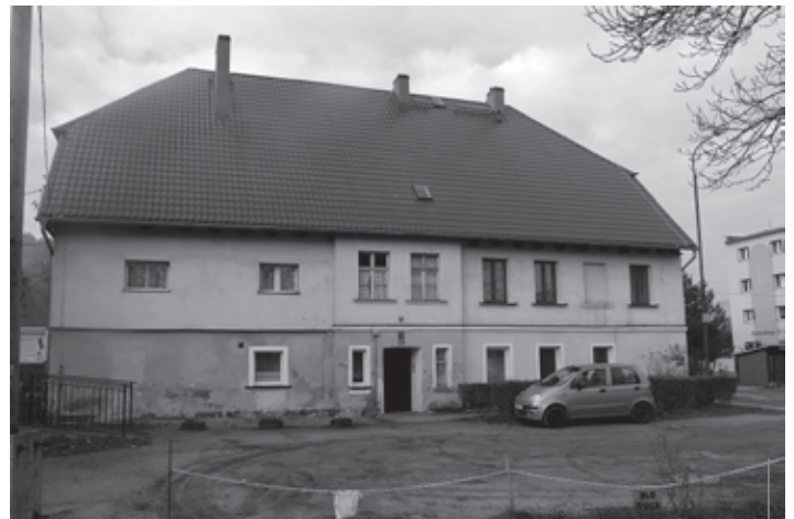
W listopadzie zakończył się remont dachu budynku przy ul. Kryształowej 12. Mieszkańcom nie będzie już ciepło z dachu.