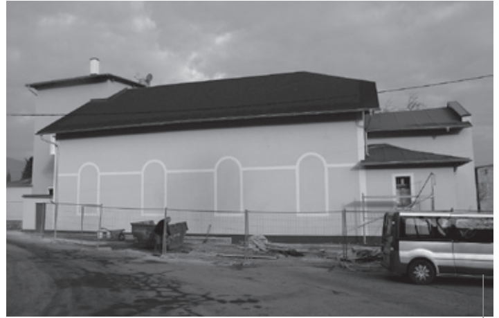
Budynek przy ul. Kryształowej 23 zmienił się nie do poznania. Po lewej zdjęcie z sierpnia, po prawej - z listopada br.

Dobiegają końca tegoroczne prace przy wymianie dachów w budynkach wspólnot mieszkaniowych.