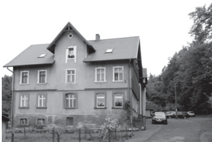
Wyremontowany dach budynku przy ul. Wolskiej 1 w Piastowie.

Możliwe, że lista ta powiększy się, gdyż kilka wspólnot jest o krok od podjęcia decyzji o remoncie.