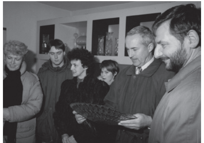
Danuta Wałęsa podczas wizyty w 1993 roku w Hucie Julia. Odwiedziła wraz z mężem Lechem zakład w Szklarskiej Porębie.