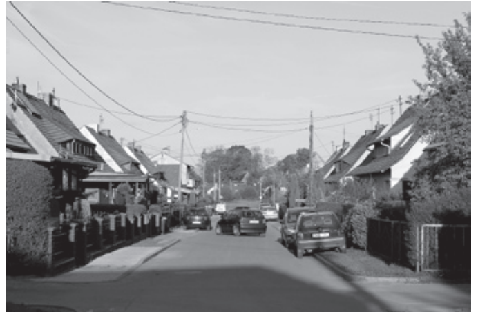
Ulica Marceliego Nowotki stała się ulicą Robotniczą.

Ulica Przemysłowa – wybór nazwy, kojarzy się z wcześniejszymi położonymi przy tej ulicy zakładami przemysłowymi,