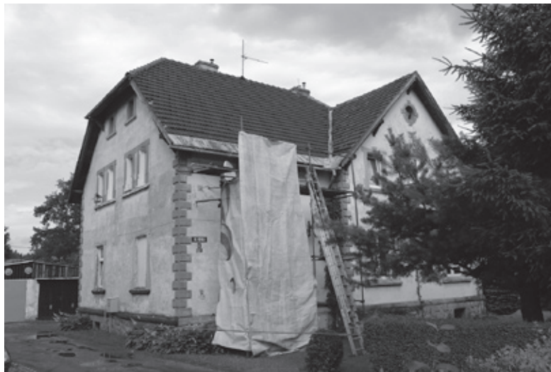
W lipcu rozpoczęła się wymiana dachu budynku przy ul. 1 Maja 8.

Warunki, oferowane przez „Wspólny Dom”, są bardzo korzystne. Wystarczy, że wspólnota podejmie uchwałę o remoncie, a całą dokumentację wraz ze zgraniem terminów, uzyskaniem pozwoleń, często też zgody konserwatora zabytków, bierze na siebie zarządca (Wspólny Dom). Mieszkańcy (ściślej – udziałowcy wspólnot) nie płacą za to dodatkowo, jest to wykonywane w ramach usługi zarządzania. Ponoszą