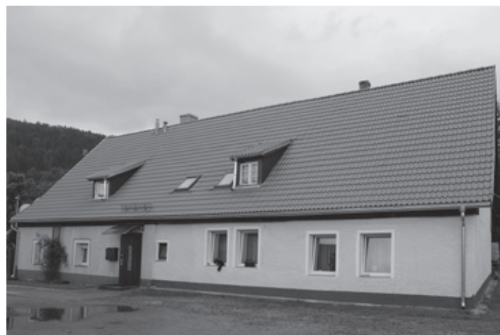
Dom przy ul. Tysiąclecia zmienił się nie do poznania.