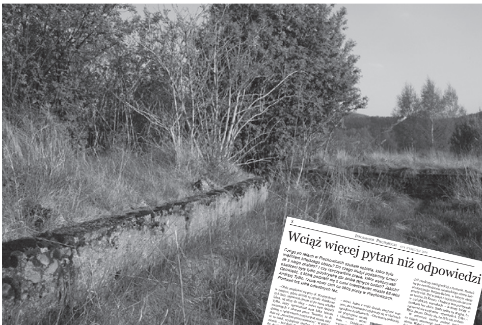
O obozie, po którym zostały niewielkie ślady, pisaliśmy w kwietniowym wydaniu „Informatora”.

dzenia, zawód, wyznanie, stan cywilny, miejsce zamieszkania tuż przed deportacją, datę osadzenia w obozie i ewentualnie datę oraz miejsce późniejszej dyslokacji. Nie w każdym przypadku wypełniono wszystkie rubryki księgi, dlatego też przy niektórych nazwiskach brakuje pewnych danych. Adres warszawski, tzn. nazwę ulicy starano się dodać w jej polskim brzmieniu. (...)