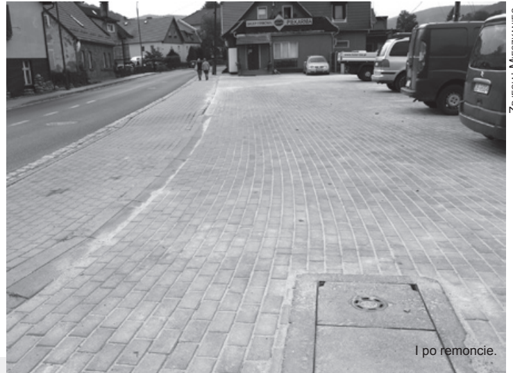
I po remoncie.