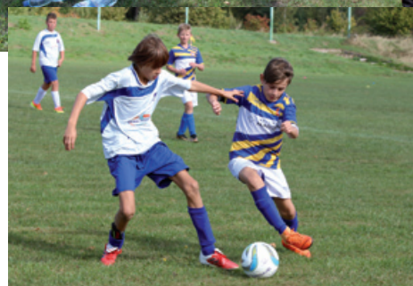
Klasa terenowa młodzików

Obok prezentujemy tabele rozgrywek młodzików (D2), trampkarzy (C2) oraz seniorów.