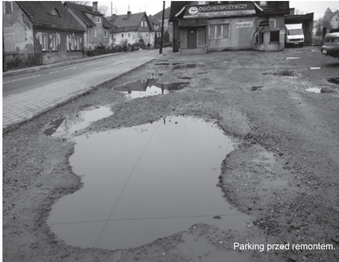
Parking przed remontem.

betonowej grub. 8,0 cm – 480 m.kw. Wartość wykonanych prac zgodnie z umową wyniosła 63.149,06 zł. Zadanie wykonała firma z Piechowic JELTECH sp. z o.o.