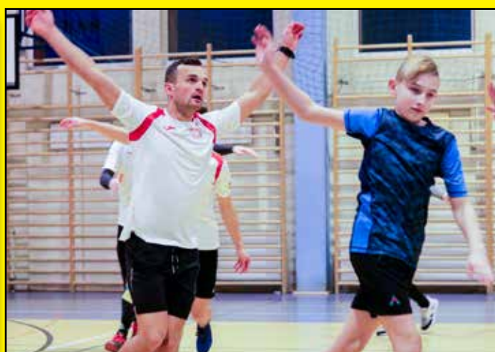
Trening Mistrza Świata

Ponadto : Zmiany w Przedszkolu Samorządowym nr 1, Uzyskaj dofinansowanie na wymianę źródeł ciepła, Sportowcy na medal, Karnawał u Seniorów, Najlepsi e-sportowcy rywalizowali w ZSTiL.