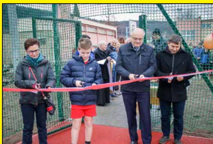
Otwarcie nowego boiska