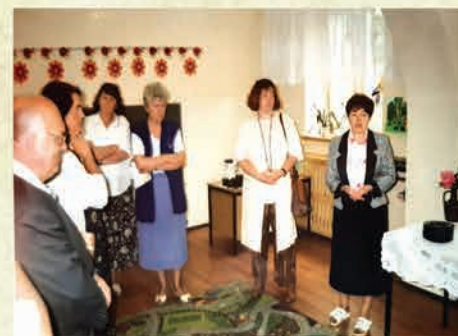
Utworzenie Świetlicy Środowiskowej - 1998 r./ w przedszkolu przy ul. Żymierskiego