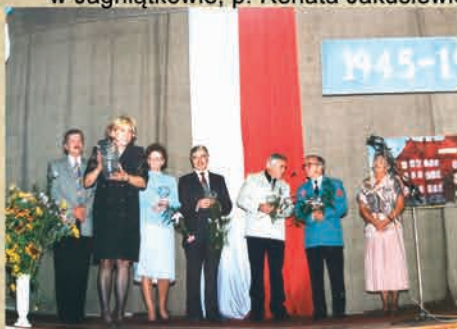
Gala z okazji 50-lecia Szkoły Podstawowej nr 1- 1995 r.