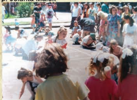
I edycja festynu "Dzień Dziecka" - 1996 r./ SP nr1