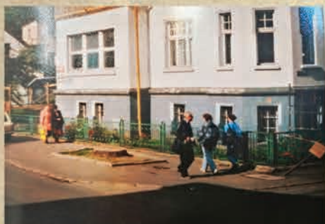
Rozpoczęte prace przy remontach chodników w centrum Piechowic- 1998r.