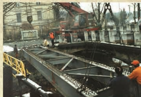
Budowa kładki dla pieszych na rzece Kamiennej/ Piechowice Górne- 1998 r.