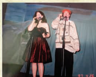
Występ Teatru Naszego – 1997 r.