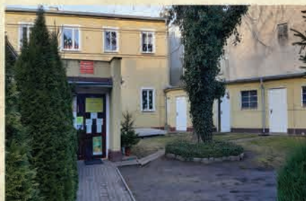
Przedszkole przy ul. Żymierskiego po rozbudowie – 1997 r.