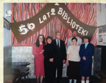
50 lat Miejskiej Biblioteki Publicznej - 1997 r.