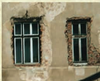
Ściana budynku POK- widok od ul. Nadrzecznej