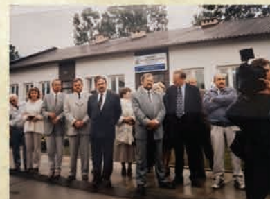
Otwarcie Miejskiej Oczyszczalni Ścieków – 1998 r