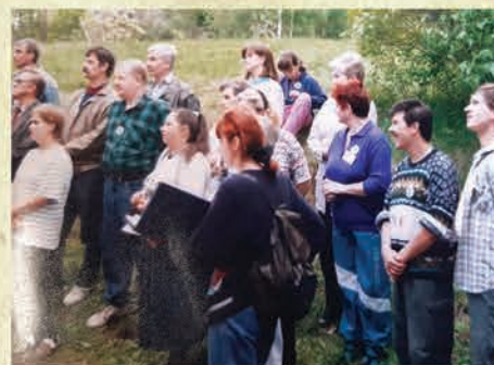
Otwarcie SSM "Złoty Widok" podczas Rajdu "Piechotka"- 1996 r.