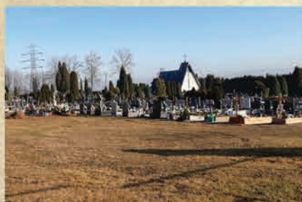
Zakończenie rozbudowy cmentarza i budowa kaplicy - 1995 r.