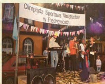
Olimpiada Sportowa Ministrantów – 1997 r.