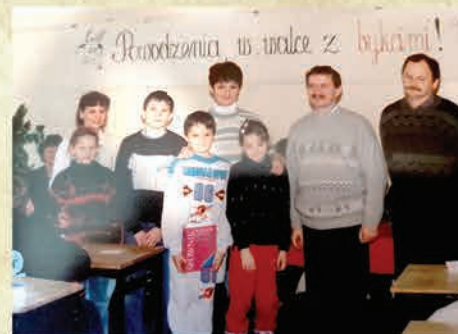
I edycja Wielkiego Dyktanda dla Piechowiczian- 1995 r./ SP nr 2