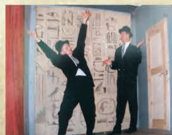
Występ Teatru Cinema – 1996 r.