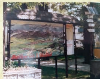
Tablica promocyjna w centrum Piechowic - 1996 r.