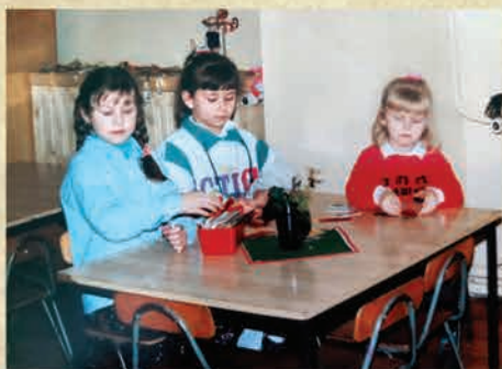
Wyremontowana sala zabaw w Przedszkolu przy ul. Żymierskiego - 1995 r.