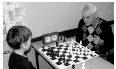
Najmłodszy i najstarszy zawodnik