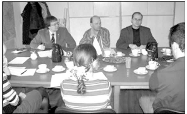
Prace nad projektem omawiano w polsko-czeskim gronie