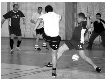
Piechowiczanie w akcji

Zawodnicy i organizatorzy – Hala Sportowa w Piechowicach i Urząd Miasta Piechowice zgodnie orzekli, że ze względu na rosnącą popularność turnieju w przyszłych latach będą kolejne edycje, na które już teraz zapraszamy.