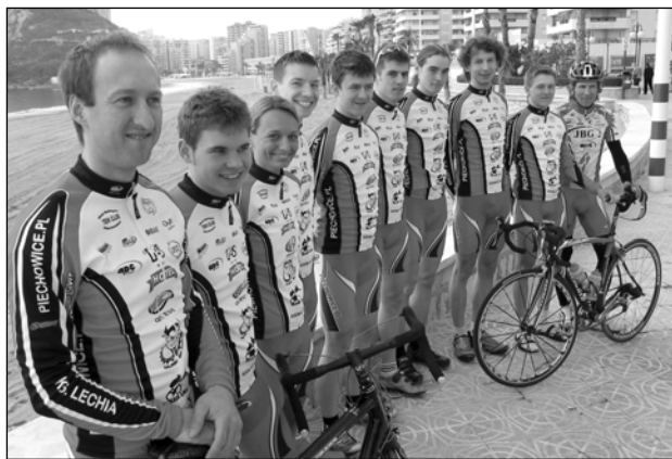
Zawodnicy liczą na dobre miejsca w wyścigach w tym sezonie

Zawodnicy KS Lechia na przełomie lutego i marca przebywali na zgrupowaniu treningowym w hiszpańskiej miejscowości Calpe na wybrzeżu Costa Blanca (2500 km od Piechowic).