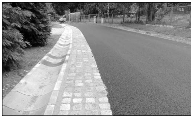
Ulica Jaworowa przed i po remoncie