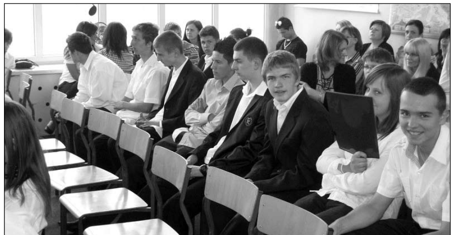
W piechowickim gimnazjum naukę rozpocznie 138 uczniów