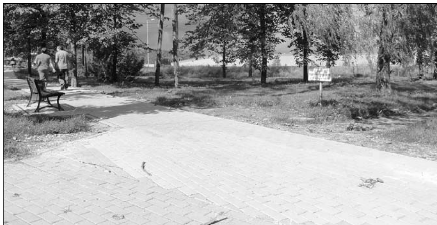
Od nowej alejki i wykarczowania 15 pni po topolach rozpoczęły się prace w parku, który w niedalekiej przyszłości będzie miejscem spotkań pokoleń. Niestety prace zostały przerwane, ponieważ ZUK po nawałnicy z 7 sierpnia pracuje przy udrażnianiu dróg dojazdowych zniszczonych przez wodę