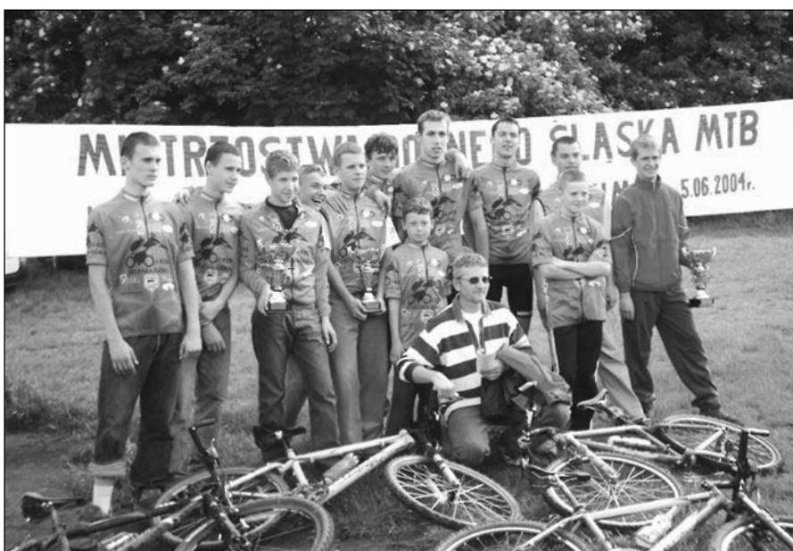
Zawodnicy z Piechowic z pucharami za zwycięstwa