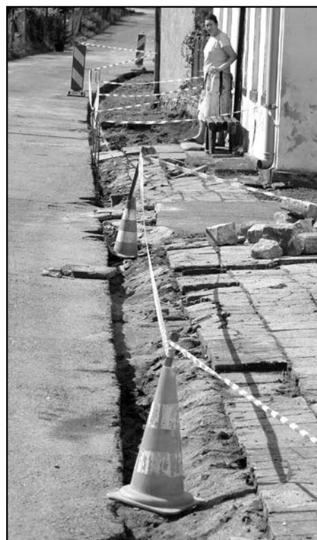
Na ulicy Kamiennej rozpoczęto remont chodników