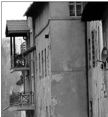
W mieście brakuje mieszkań socjalnych

Jeśli natomiast nie zgodzą się na proponowane warunki, zostaną przeniesieni do lokali socjalnych lub staną się klientami firm windykacyjnych, które ściągać będą te zadłużenia.