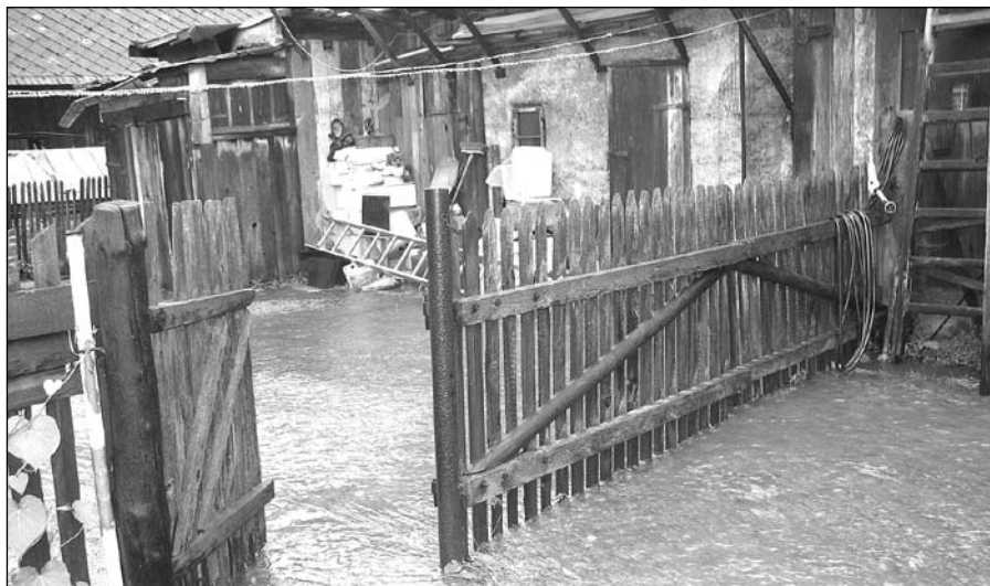
Jedno z zalanych domostw przy ul. Pakoszowskiej

W najbliższym czasie służby miejskie i prywatnych właścicieli czeka ciężka praca nad poprawieniem istniejącego stanu rzeczy.