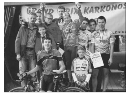
Młodzież z Piechowic zawsze garnęła się do kolarstwa

wicach. Była to Izersko-Karkonoskie Towarzystwo Kolarskie. Była to również szansa dla dzieci i młodzieży na odnalezienie się w sporcie kolarskim. Wówczas też zacząłem pisać pierwsze programy treningowe dla młodzieży. Kilko naszych zawodników zajmowało czołowe lokaty w Polsce, czego pamiętką są dzisiaj dziesiątki pucharów i medali z różnych imprez. I-KTK działało przez 4 lata. W 2007 roku powstała sekcja kolarska przy Lechii Piechowice.