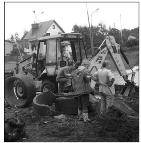
Naprawa zniszczeń popowodziowych

20 sierpnia piechowicka Wepa obchodziła swoje święto, w którym wprawdzie w powodów osobistych nie uczestniczyłam, ale tą drogą składam Zarządowi