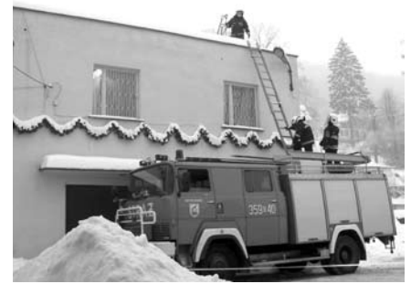
Strażacy OSP pomagają podczas zimy

nie chodników znajdujących się przy posesjach prywatnych należy do właścicieli tych posesji (patrz uchwała o utrzymaniu porządku i czystości na terenie gminy).