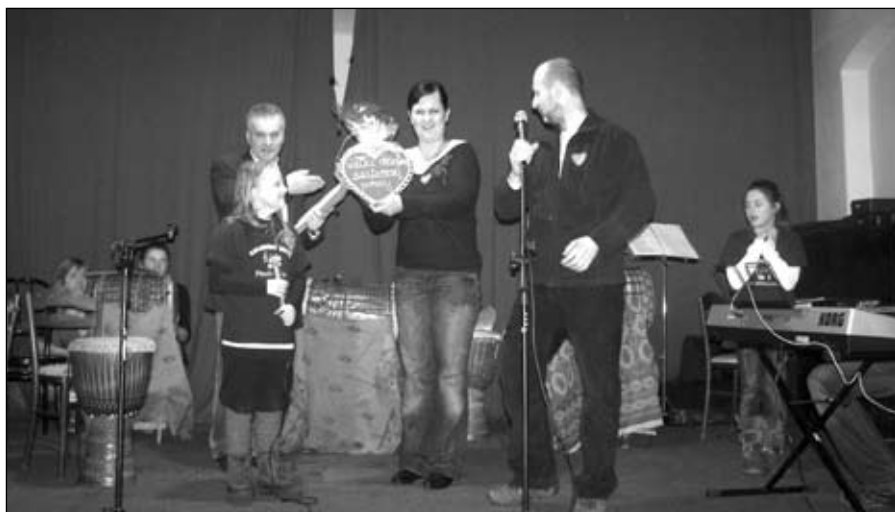
Licytacje cieszyły się dużą popularnością