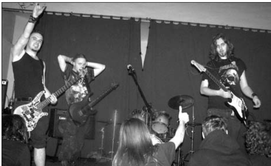
Występy muzyczne bardzo się podobały