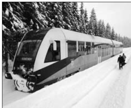
Na trasie z Piechowic do Jakuszyc są piękne widoki za oknem szynobusu

Codziennie z Piechowic odjeżdżają dwa składy pociągów o godz. 12.22 i 18.21. Nowoczesny szynobus przystosowany jest do przewozu rowerów (ważne latem) i można w nim swobodnie przewozić narty. Jest to znakomite rozwiązanie dla narciarzy biegowych, którzy chcą się dostać do Jakuszyc na trasy biegowe. Można wyruszyć z Piechowic w południe, a wrócić wieczorem. Po drodze czas się nie dłuży, bowiem za oknem klimatyzowanego pociągu można podziwiać piękną widokowo trasę.