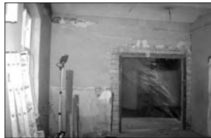
Po remoncie biblioteka będzie wyglądać jak nowa

Od 27 grudnia trwają prace remontowe w Miejskiej Bibliotece Publicznej w Piechowicach. Celem tych działań jest odnowienie i powiększenie pomieszczeń bibliotecznych.