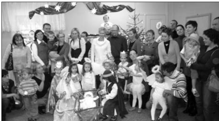
Rodzice cały czas trzymali kciuki za dobre występy swoich pociec