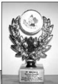
Takie statuetki otrzymały uczestniczki rajdu

Organizatorami działania są NZOZ „M.C. Zahorscy” s. c. i FZPOZ „Porozumienie Zielonogórskie”. Zajęcia zorganizowane zostały we