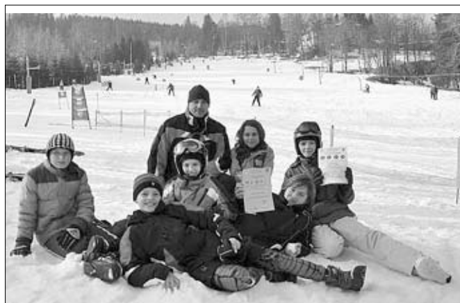
Piechowiccy uczestnicy zawodów, fot. Daniel Potkański

11 stycznia w Karpaczu odbyły się Mistrzostwa Powiatu w Narciarstwie Alpejskim. Bardzo dobrze zaprezentowali się uczniowie Szkoły Podstawowej nr 1 w Piechowicach.