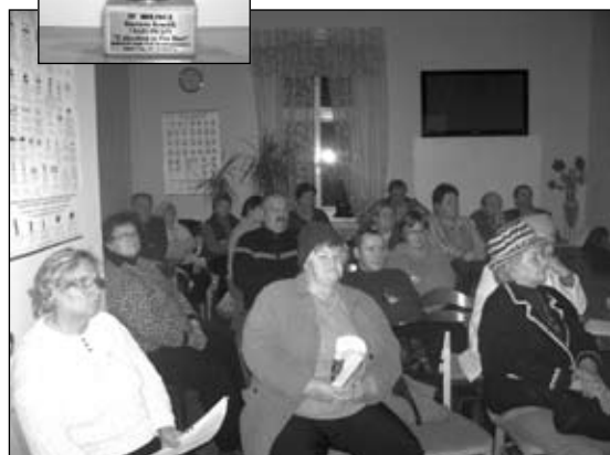
W każdym spotkaniu uczestniczy 30-40 osób

Więcej szczegółów na temat „Szkoły Cukrzycy” pod nr tel. 75 76 17 201.