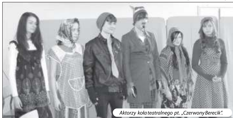
Aktorzy koła teatralnego pt. „Czerwony Berek”