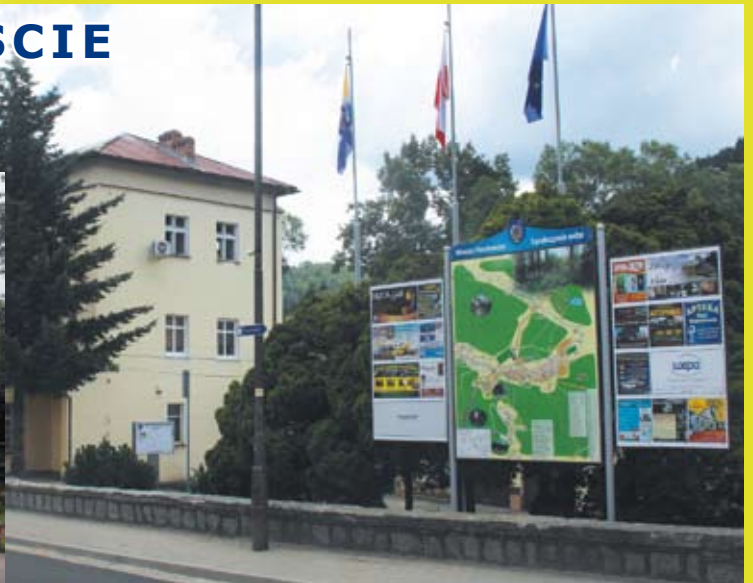
Nowe tablice stoją przy Urzędzie Miasta i obok totalizatora Sportowego.