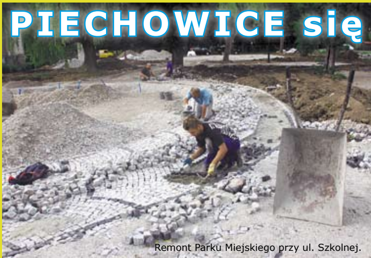
Remont Parku Miejskiego przy ul. Szkolnej.