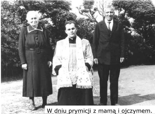
W dniu prymicyj z mamą i ojczymem.