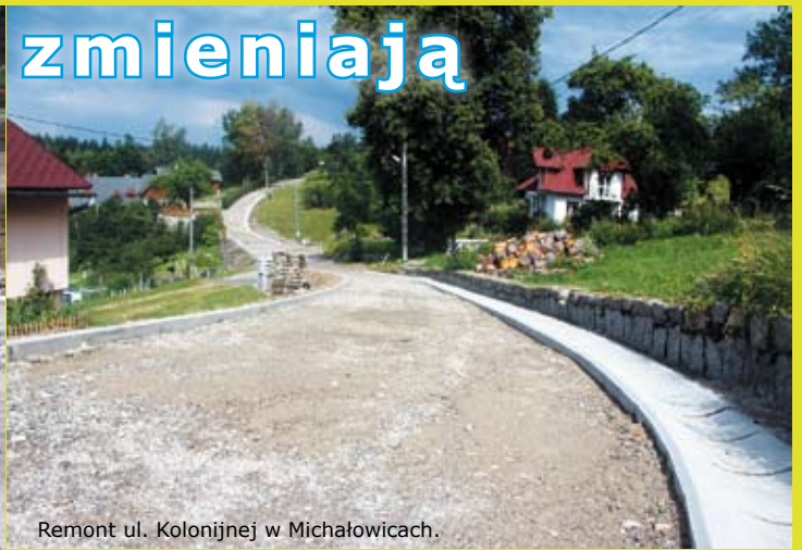
Remont ul. Kolonijnej w Michałowicach.