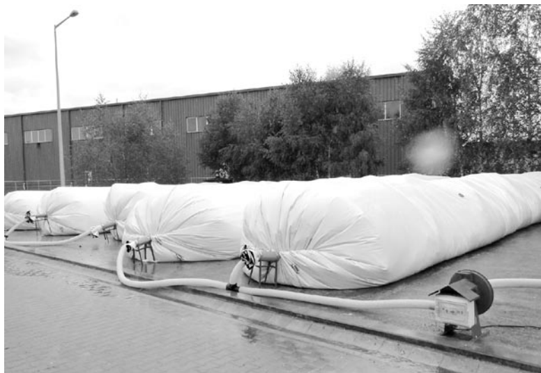
Kompostownia tunelowa w Karkonoskim Centrum Gospodarki Odpadami.

Makulatura - niepotrzebne lub zniszczone wyroby papiernicze, nadające się bezpośrednio do wtórnego wykorzystania w innych celach niż były przeznaczone pierwotnie lub nadające się jako jeden z surowców do produkcji nowego papieru. Wrzucamy ją do niebieskiego pojemnika na odpady segregowane.