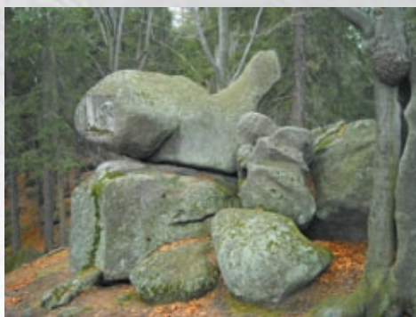
Trasy spacerowe w Michałowicach str. 10