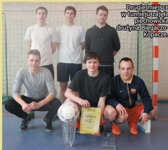
Drugie miejsce w turnieju zajęła piechowicka drużyna Biegaczo-Kopacze.

Organizatorem zawodów byli Hala Sportowa