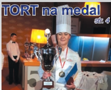
TORT na medal str. 4