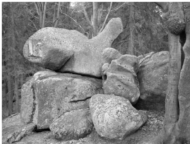
Kociołki w Michałowicach na starej fotografii (poniżej) oraz dzisiaj (zdjęcie powyżej).