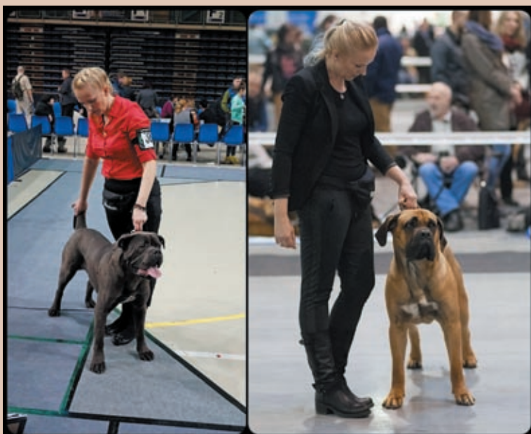
Paco (po lewej) i Iron uczestniczą już w wystawach psów.