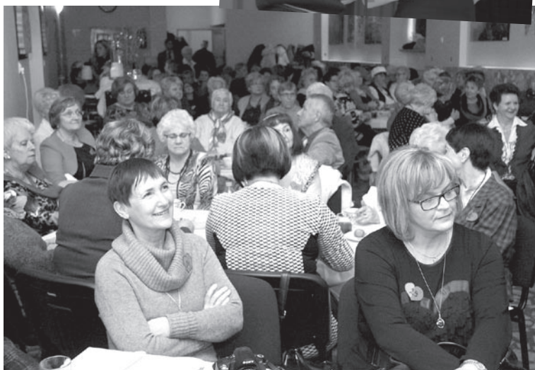
Fot. R. Zapora