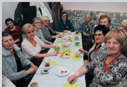
Dzień kobiet str. 10