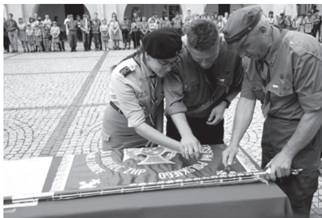
Instruktorzy z Piechowic mają „swojego” gwoździa na drzewcu.