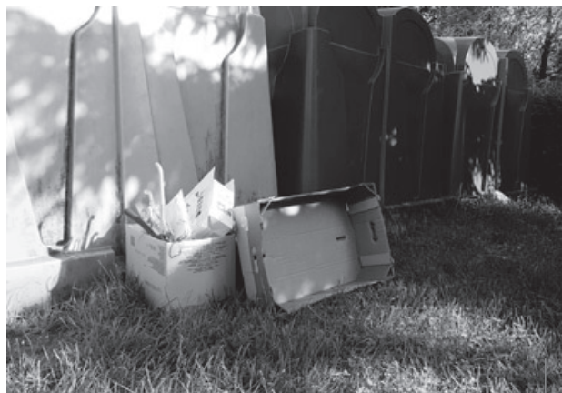
Te kartony można było wrzucić do pojemnika. Niestety, ktoś je postawił za pojemnikiem, zostawiając bałagan.

W związku z powtarzającymi się sytuacjami „podrzucania” odpadów wielkogabarytowych oraz zużytej odzieży do obsługiwanych przez KCGO gniazd do segregacji odpadów (tzw. „dzwonów”) przypominamy, że zgodnie z obowiązującym Regulaminem utrzymania czystości i porządku na terenie gminy miejskiej Piechowice, każdy mieszkaniec ma możliwość nieodpłatnego przekazania tych odpadów do Punktu Selektywnej Zbiórki Odpadów Komunalnych