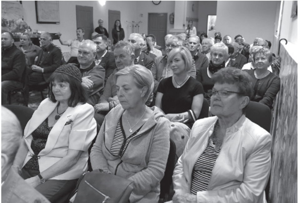
Na spotkanie promujące książkę w POK-u przyszło sporo mieszkańców.

– Teraz zapadła decyzja, że poszerzymy zakres tego, co piszemy o Piechowicach nie tylko o historię, ale o wszelkie inne zagadnienia natury gospodarczej, kulturalnej, sportowej, turystycznej, oświatowej itp.