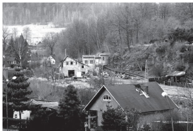
Dzisiaj po dawnym zakładzie nie ma śladu.

Gdzie ma początek ta historia? U nas, w Piechowicach. Zakład farmaceutyczny „Labopharma” mieścił się przed wojną w Berlinie i produkował leki, kosmetyki,