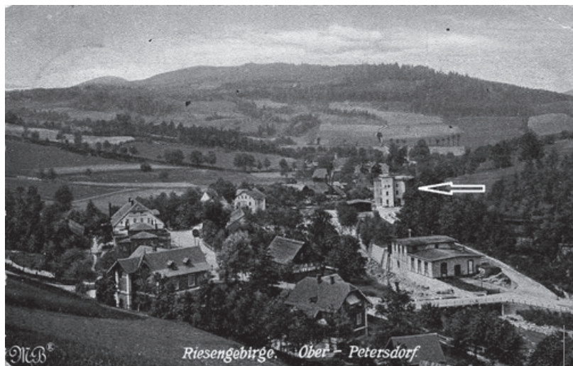
W 1943 roku niemiecką Labopharmę przeniesiono w tajemnicy do ówczesnego Petersdorfu.