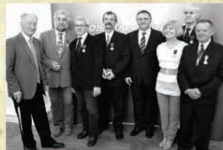
Nadanie odznaczeń za popularyzację turystyki – 2015 r.