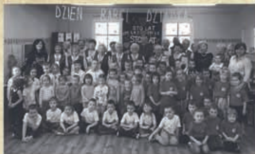
„Seniorzy Przedszkolom, Przedszkolaki Seniorom” /PS nr 2- 2017 r.