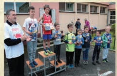
Bieg 50-lecia na terenie gimnazjum - 2017 r.