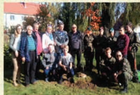
Zasadzenie „dębu niepodległości” z inicjatywy ZSTiL / Szklany ogród- 2017 r.