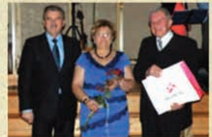
Dzień Seniora – 2015 r.