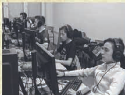
Turniej gry w Counter Strike /ZSTiL- 2017 r.