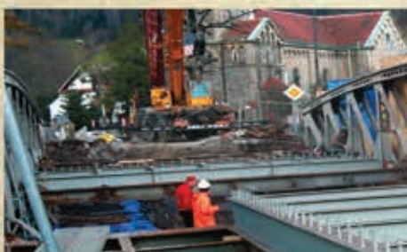
Kapitalny remont mostu nad rzeką Kamienna wykonany przez DSDiK – 2014/15 r.