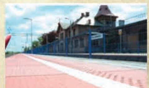
Remont peronów i przejazdu kolejowego wykonany przez PKP PLK – 2016 r.