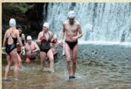
I edycja „Kropelka Run”- 2017 r.