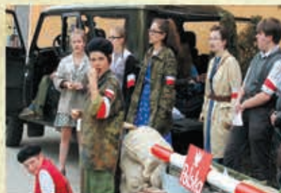
Inszenizacja historyczna „Koniec wojny” – 2015 r.