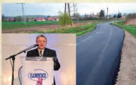
Wykonanie nowej nawierzchni na ul. Polnej przy współpracy z WEPA SA. – 2017 r.