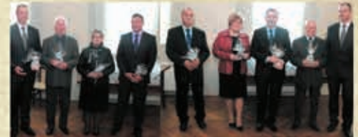
Uroczysta Sesja Rady Miasta Piechowice z okazji 25- lecia samorządu terytorialnego w Polsce - maj 2015 r.