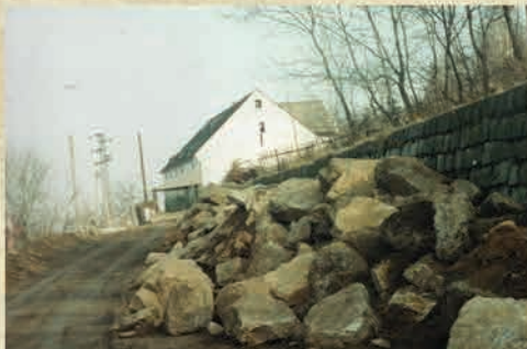
Remont ul. Nadrzeczná- 1998 r.