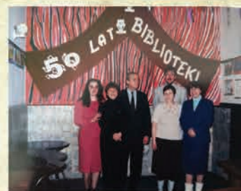
50 lat Miejskiej Biblioteki Publicznej - 1997 r.