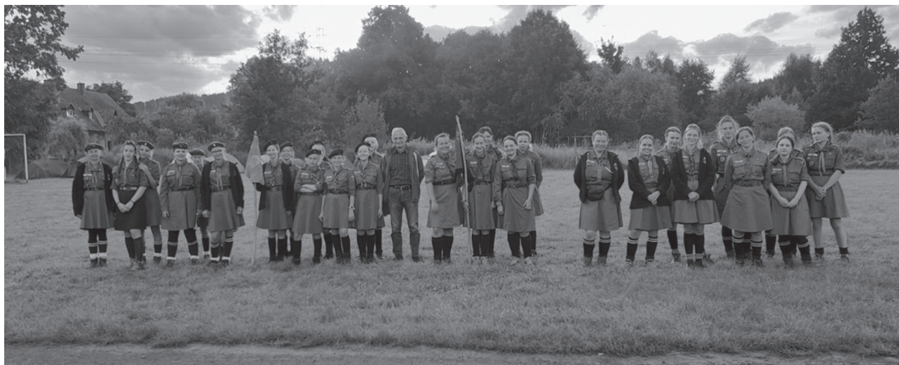
Harcerki z 1 Gdańskiego Hufca Harcererek „Więźba”

Zostałyśmy bardzo mile zaskoczone wieloma turystycznymi atrakcjami oraz gościnnością i życzliwością mieszkańców Piechowic. Jesteśmy pod wielkim wrażeniem, że ludzie w górach są tacy mili i uprzejmi. Dzięki Wam jesteśmy pewne, że dobro wraca i tego Wam życzymy! Do zobaczenia! Dziękujemy!