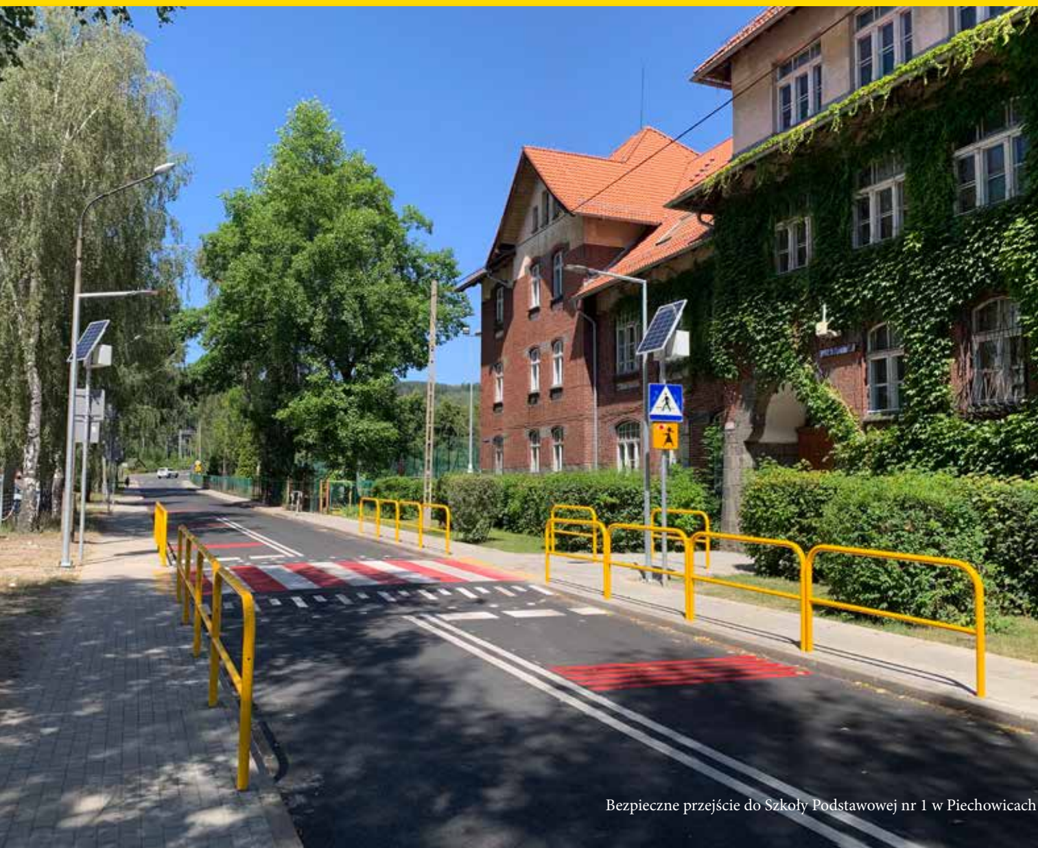
Bezpieczne przejście do Szkoły Podstawowej nr 1 w Piechowicach